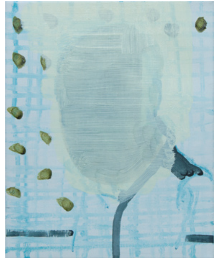
Ci-dessus, Autoportrait, huile sur toile, 25 x 20 cm, 2008.

Extrait de texte issu du cahier n°2 - « L'exercice d'une peinture », Du Tintoret, par Claude Lorent, 2007.