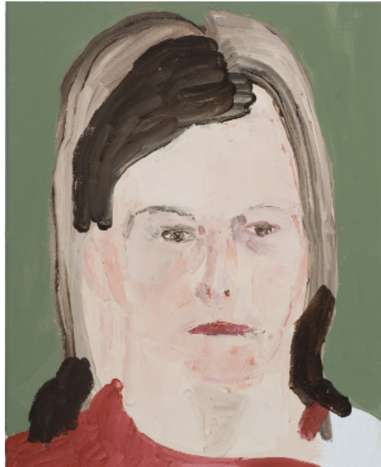
En haut à gauche, Bernard Gaube, portrait de Co, huile sur toile, 46 x 37 cm, 2009.

Jeanpascal Février , conçoit la peinture aussi par le biais de l'index photographique, comme une empreinte lumineuse, mouvante, toujours allusive et parfois évocatrice. C'est parce que le brossage détient toute la lumière des passages qu'il surface, et tente d'obtenir par cette action superposée à la représentation, une transfiguration. La peinture aurait une valeur anachronique et donc, symptomatique d'un imaginaire contemporain quand celui-ci pense l'image dans une double temporalité, muséale et instantanée.