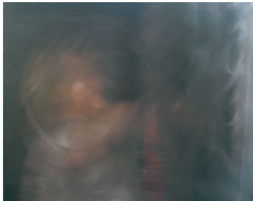
Page de gauche, série A contrario, Le polyèdre d'Alberto Giacometti, huile sur toile, 130 x 160 cm, 2009.