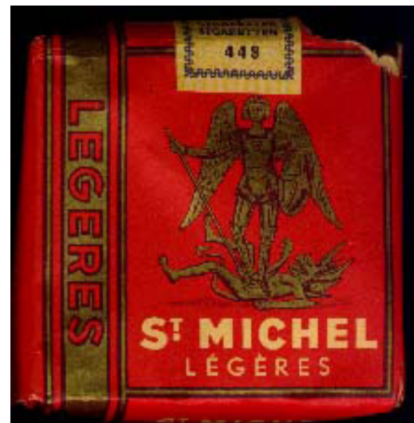
En bas, image internet de l'emballage d'un paquet de cigarettes Saint-Michel.

1 Bernard Gaube, L'exercice d'une peinture , CAHIER N°1 - 2003 ; CAHIER N°2 - 2007 et CAHIER N° 3 - 2009, Bernard Gaube - Editeur