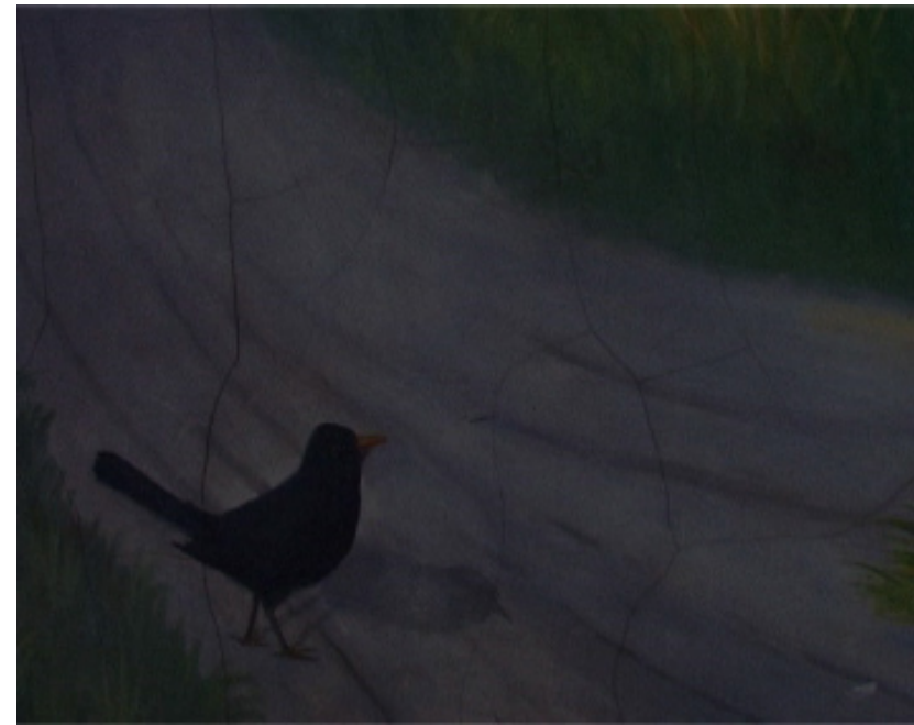
A droite, Aldo Guillaume Turin, photogramme du film L'immensité, 2007.

1 Bernard Gaube, L'exercice d'une peinture , CAHIER N°1 - 2003 ; CAHIER N°2 - 2007 et CAHIER N° 3 - 2009, Bernard Gaube - Editeur